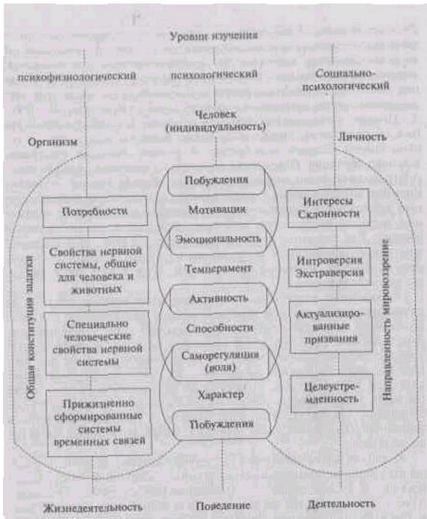
Рис. 3.1. Соотношение природного и социального в структурах индивидуальности и личности

индивидуальные свойства (они расположены слева) — это возрастные, половые, конституциональные (телосложение, биохимические свойства), нейродинамические свойства, особенности, связанные с геометрией больших полушарий, и другие. Эти первичные свойства определяют динамику вторичных — психофизиологических функций и органических потребностей. Наивысшая интеграция этих свойств — темперамент и задатки. Первичные обычно называют первичными, вторичные — психодинамическими (5, с. 53).