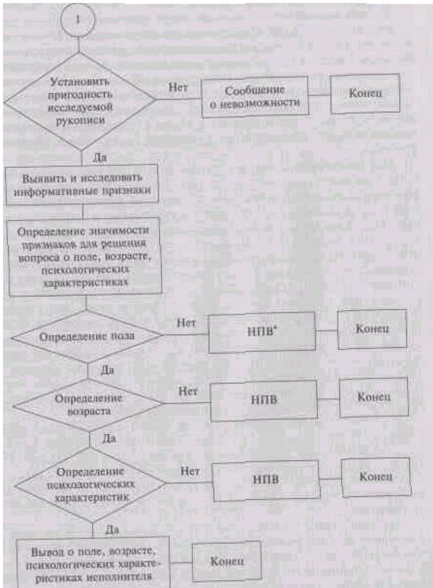
Рис. 5.1. Блок-схема решения атрибутивно-диагностической задачи

стенном (измерение) уровнях. Более конкретно блок-схема решения этого вида задач выглядит следующим образом (см. рис. ->.i)-