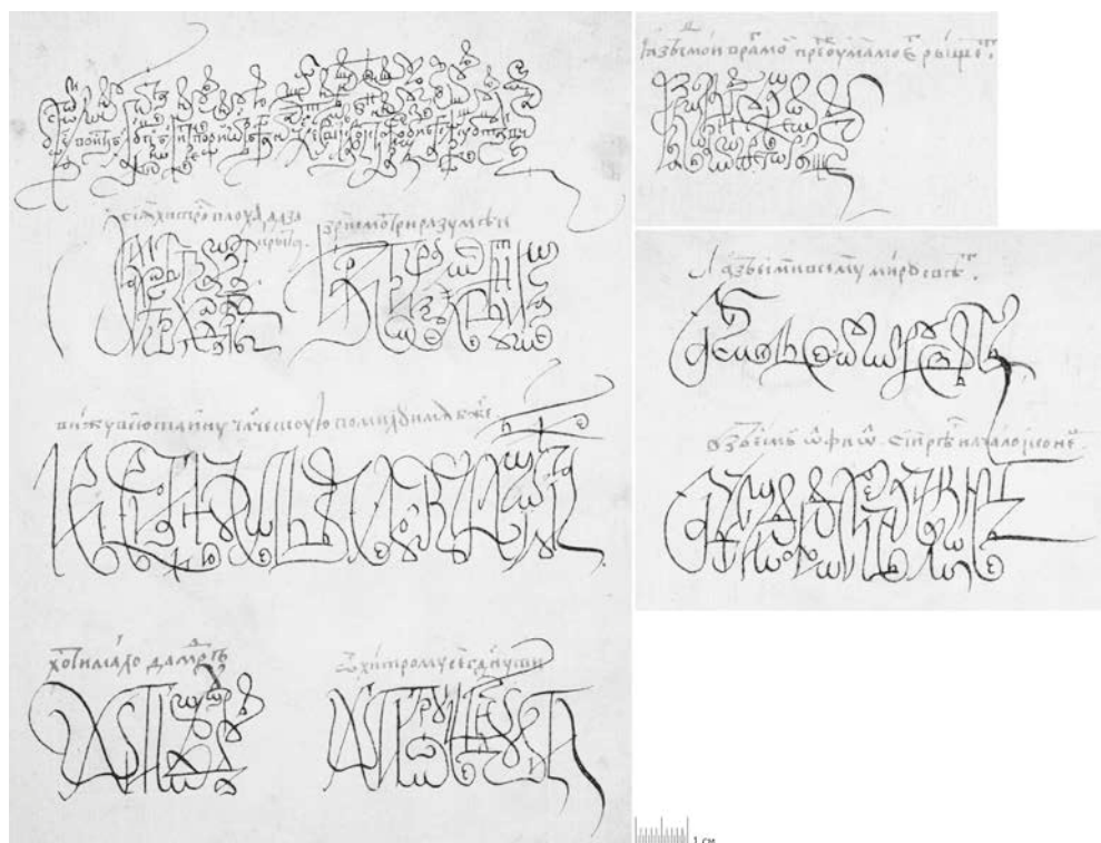
Рис. 1б. Остальные монокондильные композиции из «Азбуки фряской» 1604 г. (СПБИН РАН, ф. 115, № 160, л. 92, л. 91об., л. 92об.). Писец Ф. С. Басов